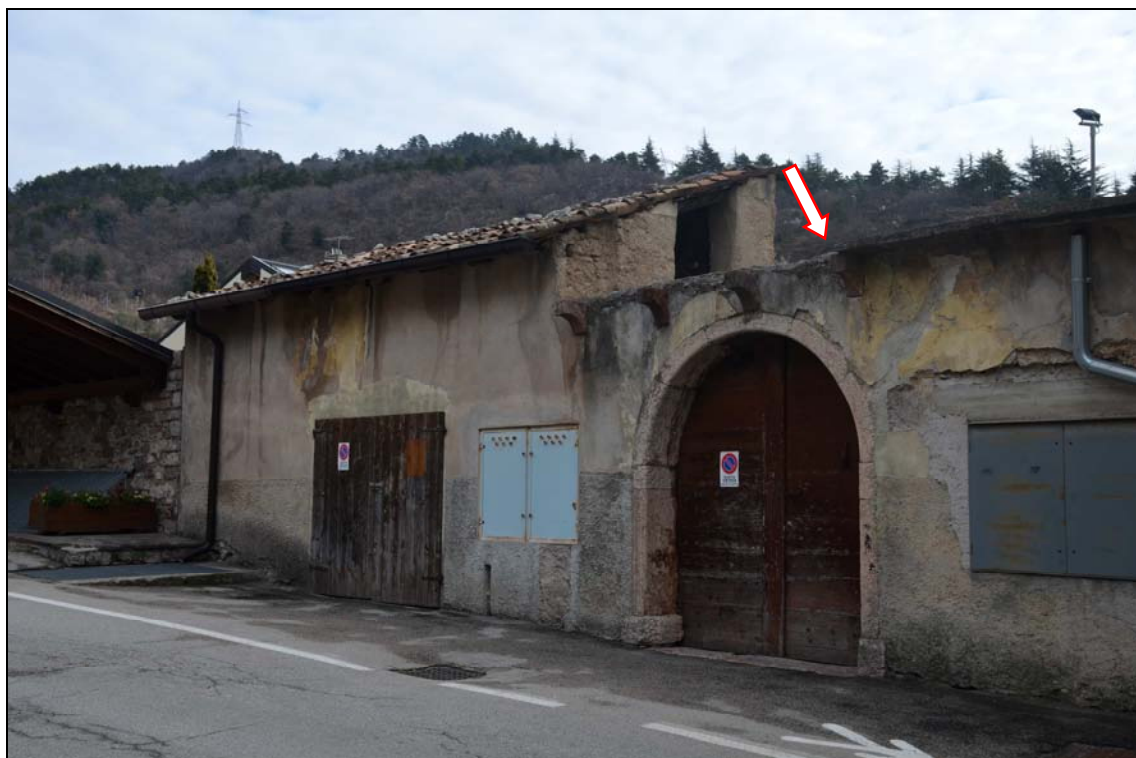
Fronte ovest lungo via Roma