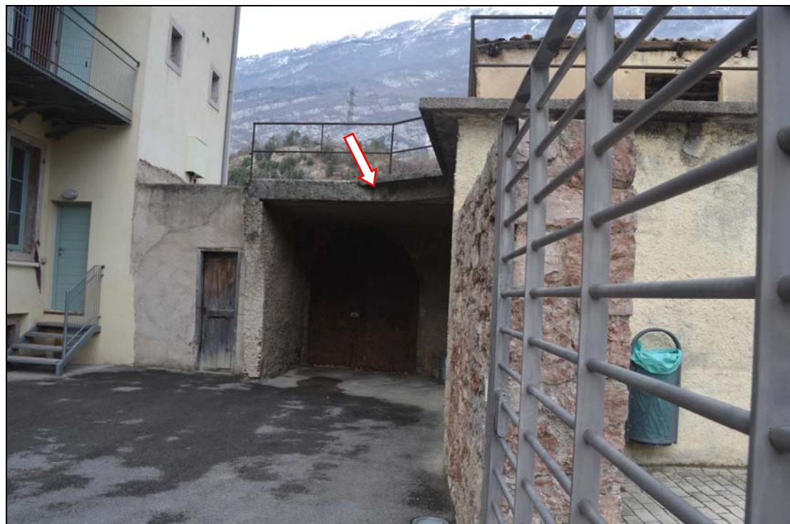
Volume esistente sul fronte esterno in corrispondenza del portone di ingresso